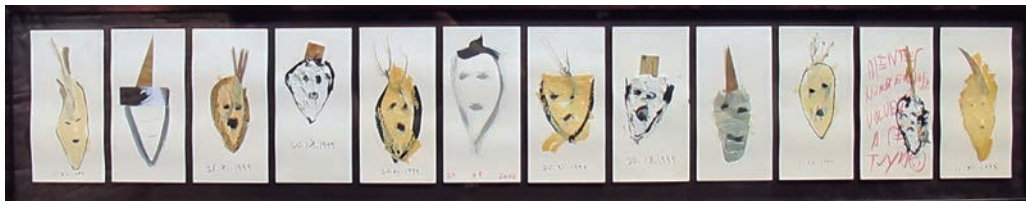
Sèrie Cares de l'anima , 1999. Tècnica mixta sobre paper, 29x145