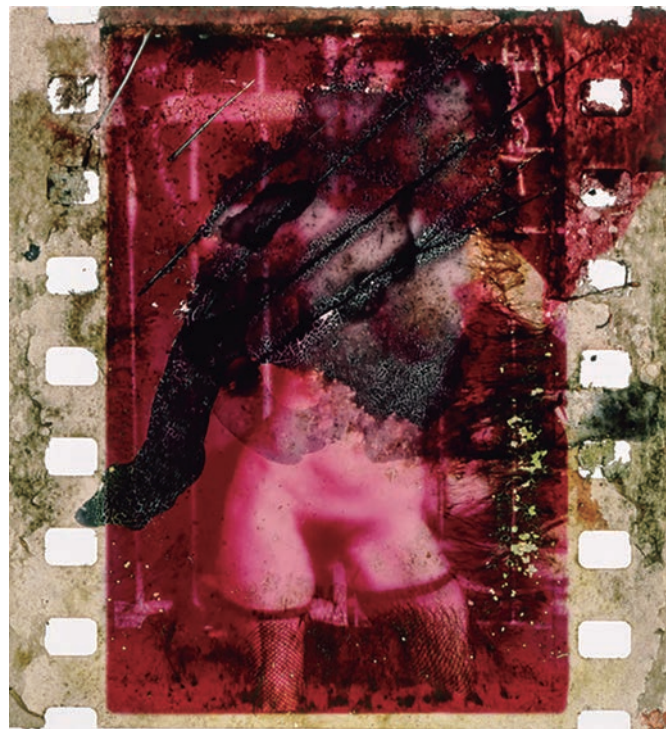
Imatges de la sèrie A fior di pelle , 2012. Ampliació de negatiu intervingut.80x96