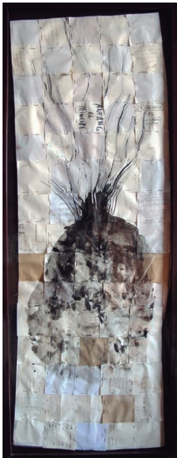
Llavor de la sèrie Anfang , 1999. Paper, agulles i tinta, 139x52