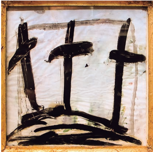
Cruces , 1993. Tinta sobre paper, 32 x32