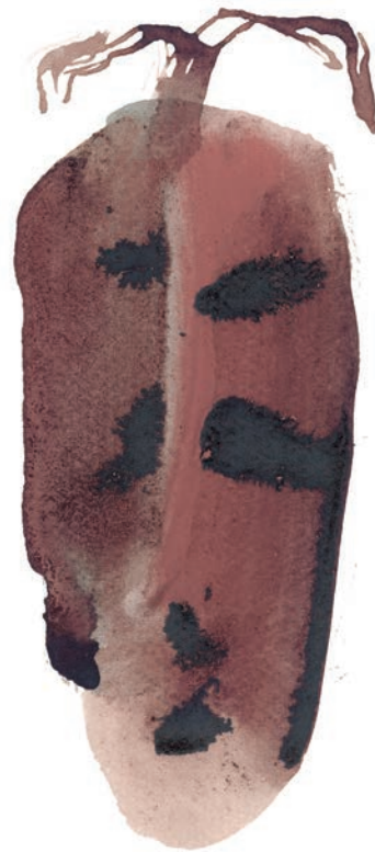
Sèrie Llavors , 2008. Ampliacions digitals de peces originals, 200x135 c/u