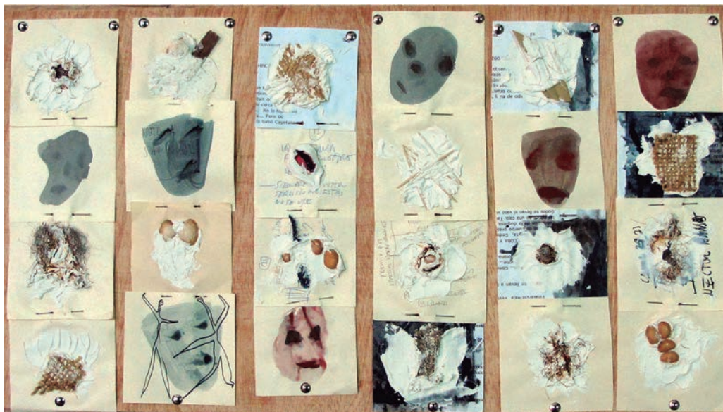
Cares de l'anima/ Anfang , 1999. Matèries i agulles sobre paper, 8 tires de 36x10