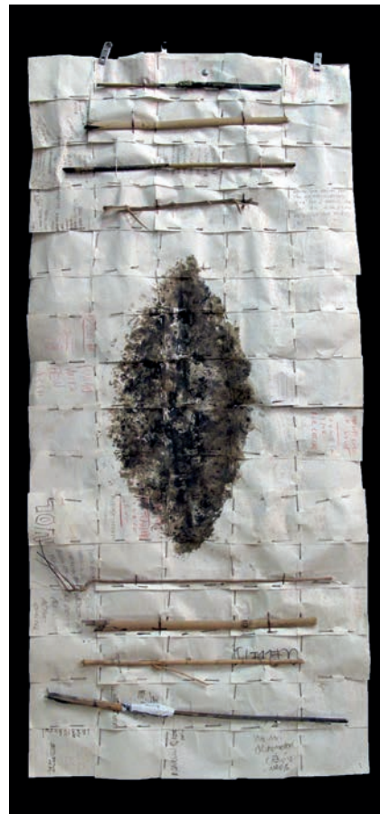
Anfang (Origen) 1999. Paper, agulles, canyes i tinta, 101x48