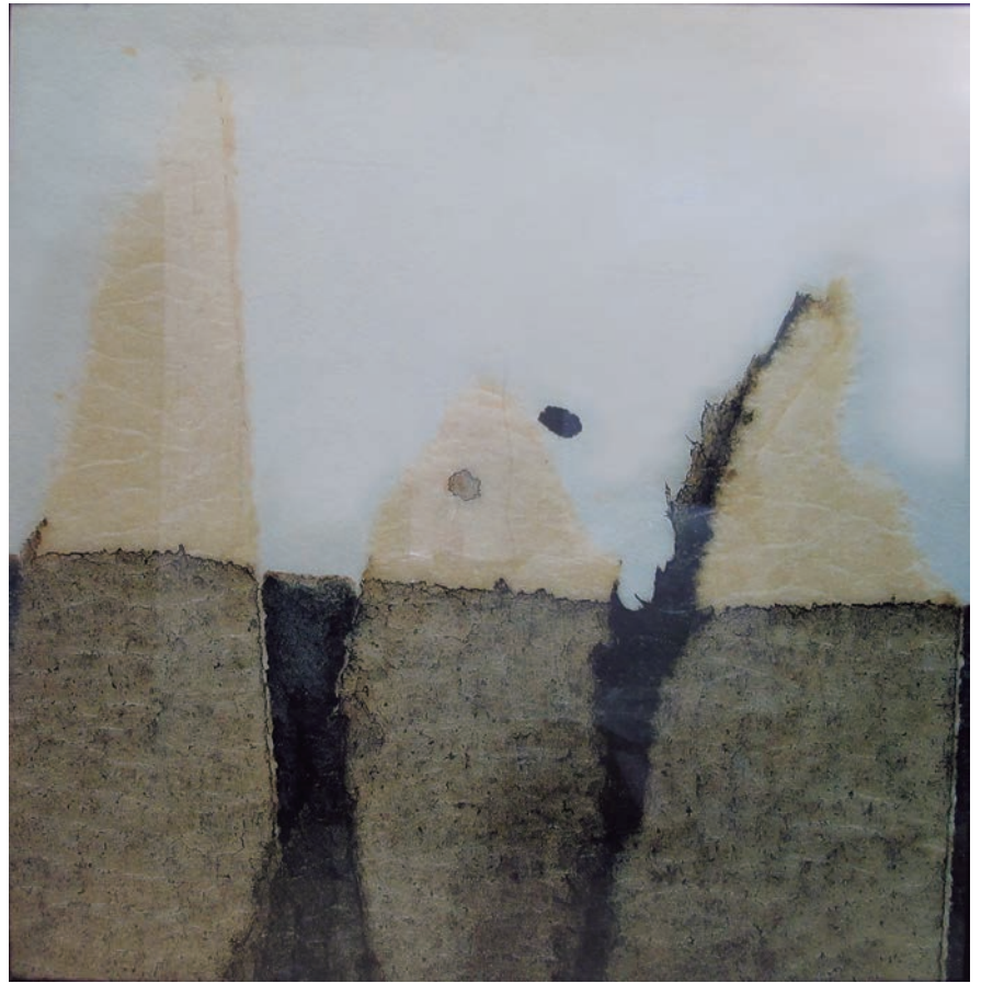
Sèrie Microcosmos: cara de l'anima 2002 i ampliació digital de detall, 2012. 29x19 i 124x124