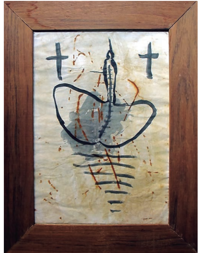
Dona (Erosignes) , 1999. Tinta i òxid sobre paper, 60x48