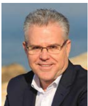
Pere Granados Carrillo Alcalde de Salou